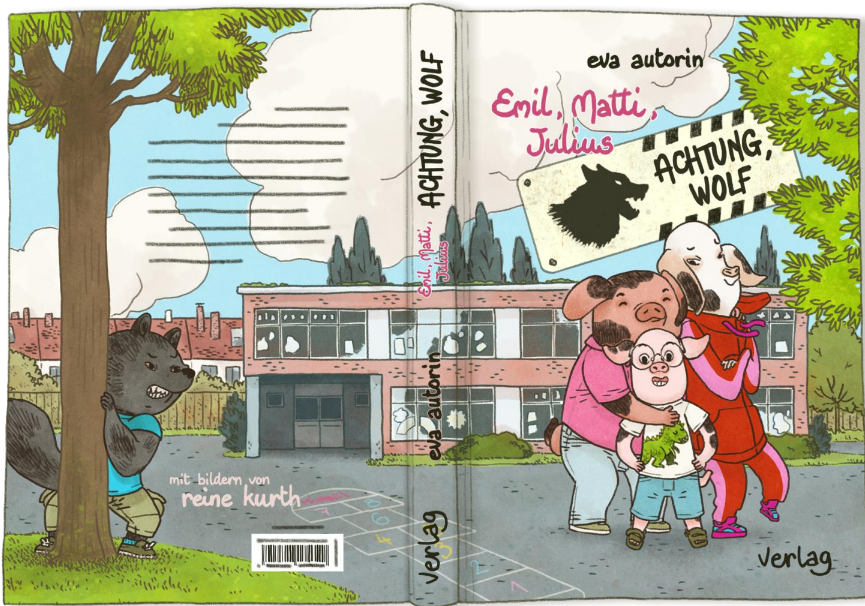
Achtung, Wolf Cover-Illustration, Lettering Freie Arbeit