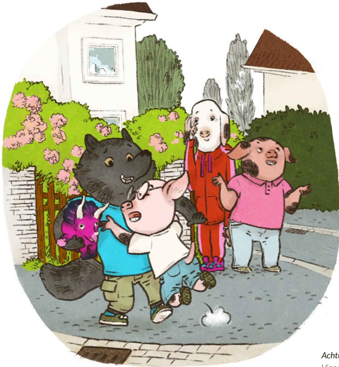
Achtung, Wolf Vignette Freie Arbeit