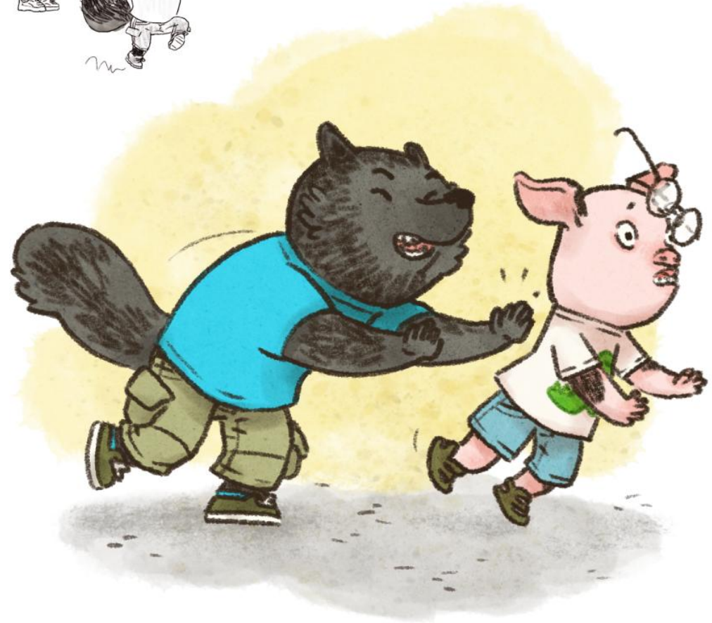
Achtung, Wolf Charakter-Entwicklung; Vignette Freie Arbeit