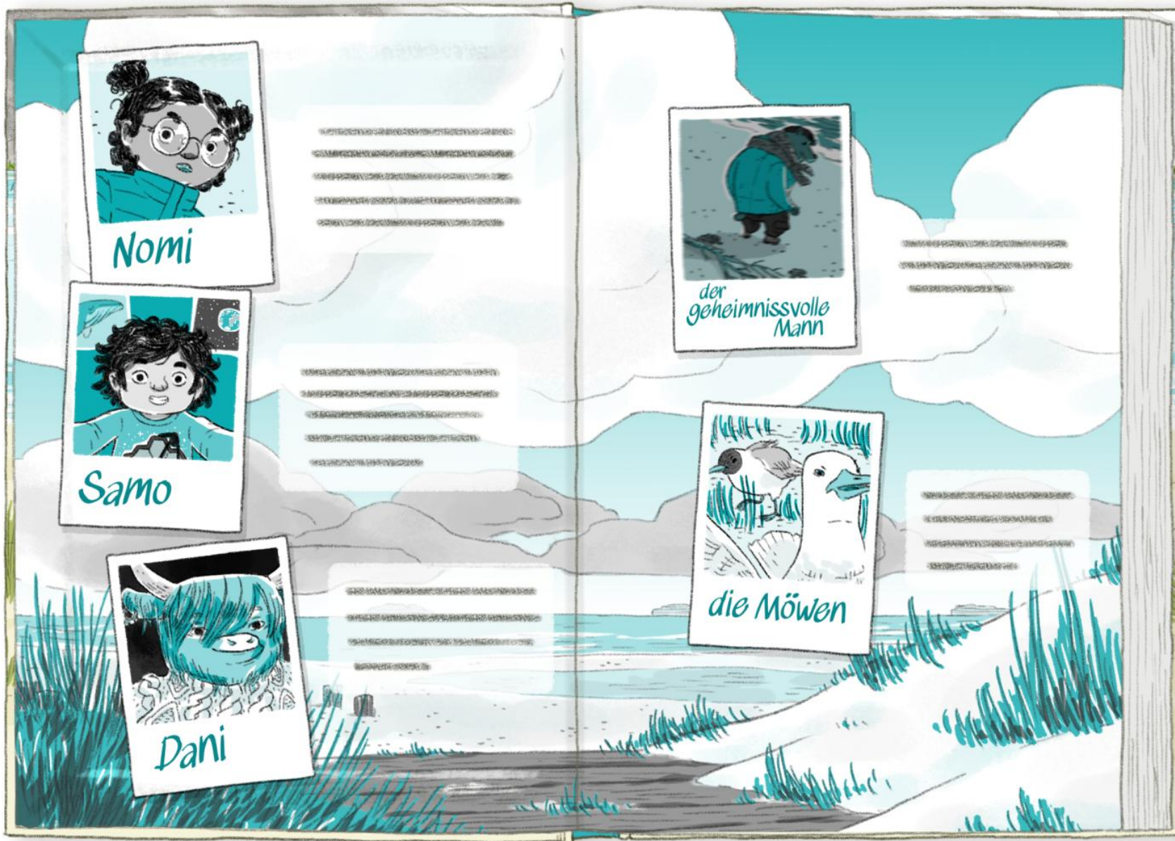
Das Geheimnis auf der Insel Charakter-Vorstellung (Vorsatzpapier) Freie Arbeit