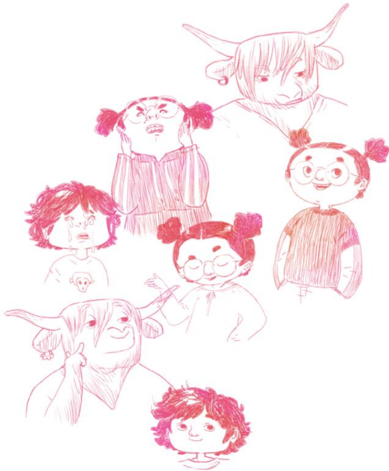
Das Geheimnis auf der Insel Charakter-Skizzen; Ganzseitige Illustration Freie Arbeit